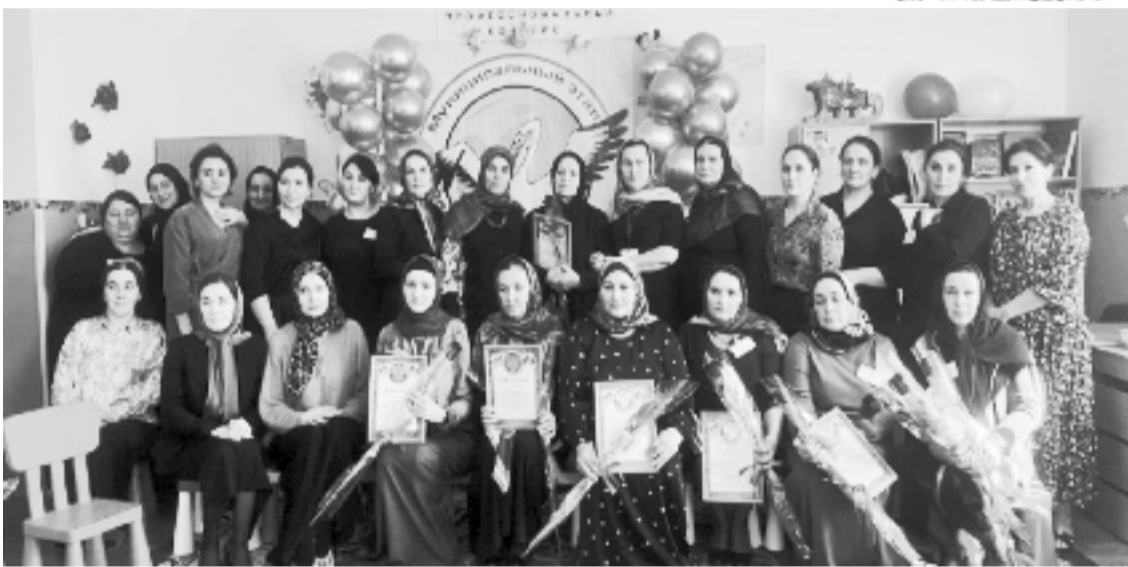
Суратлизиб: воспитательтала конкурсла бутлакъянчиби.

«Воспитатель года России 2024 года» ибси районна къадрила конкурсличир цаибил мерличичи лайикърикиб Ахъушала