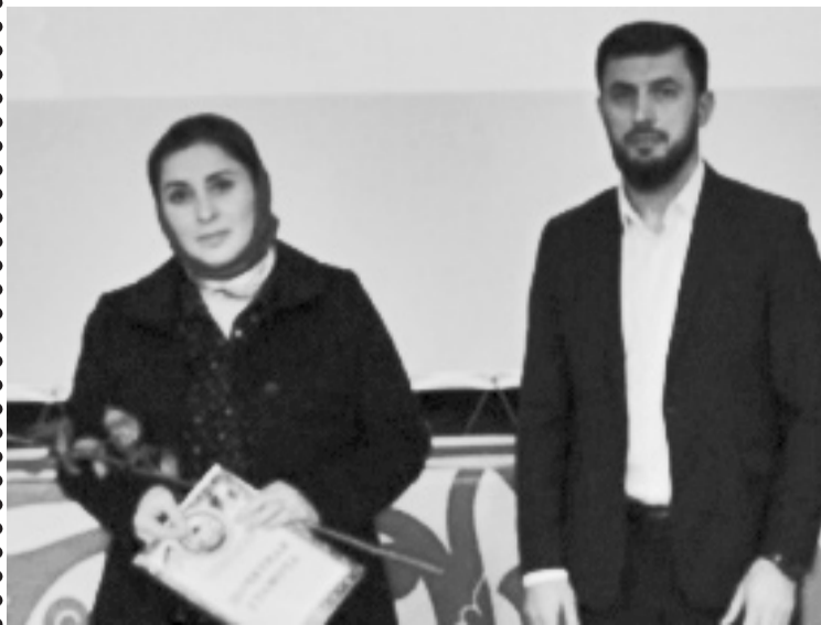
Суратлизиб: М. Гіябдулкаримовли П. Зияудинова мубаракриули.